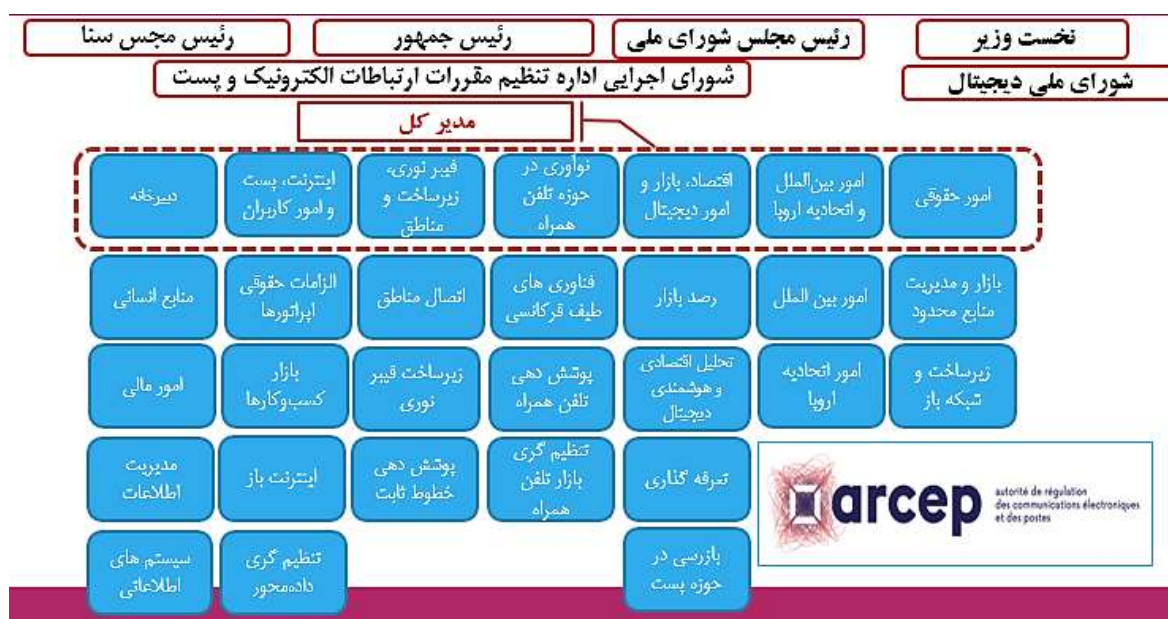
شکل ۱: ساختار حکمرانی در کشور فرانسه

در کشور فرانسه، اداره تنظیم مقررات ارتباطات الکترونیک و پستی (ARCEP) مسئولیت تنظیم‌گری و مشارکت در تدوین سیاست‌ها و قوانین در حوزه فضای مجازی را به عهده دارد. همچنین، شورای ملی دیجیتال (CNNum) به‌عنوان یک نهاد مشورتی با دولت همکاری می‌کند.