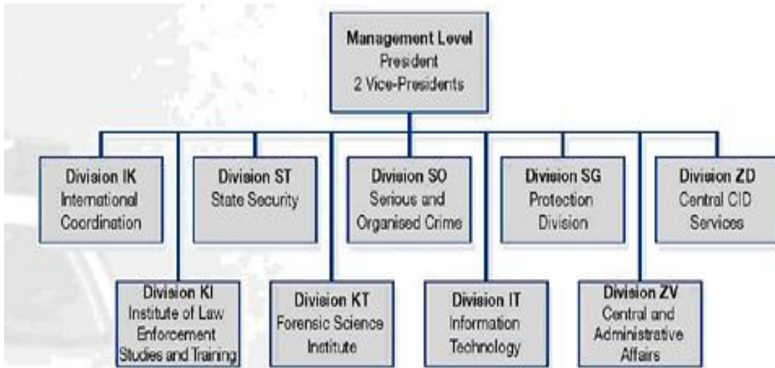
شکل ۱: چارت سازمانی BKA

در BKA بیش از ۵۵۰۰ نفر برای محافظت از امنیت داخلی در آلمان نقش مستقیم دارند. اکثر این افراد در ویسبادن، برلین و بن مستقر شده‌اند. در BKA متخصصان طراز اولی در حوزه‌های مختلف گرد هم می‌آیند: علوم جنایی، علوم طبیعی و اجتماعی، حقوق، اقتصاد و تکنولوژی اطلاعات و اداره. تقریباً نیمی از این تعداد کاملاً آموزش دیده در امور پلیسی هستند. نیم دیگر شامل بیش از ۷۰ گروه شغلی است. ۳۴ درصد کارکنان عضو کارمندان خدمات دولتی هستند؛ تقریباً ۱۲ درصد کارکنان مأموران اداری و دیگر افسران هستند. ۳۸ درصد کارکنان زن هستند. خود BKA افسران پلیس جنایی را در کالج فدرال اداره عمومی تعلیم می‌دهد. ساختار سازمانی BKA دائماً بهینه می‌شود. از ژانویه ۲۰۰۵، BKA در چارچوب ۹ واحد سازمانی وظایفش را انجام می‌دهد.